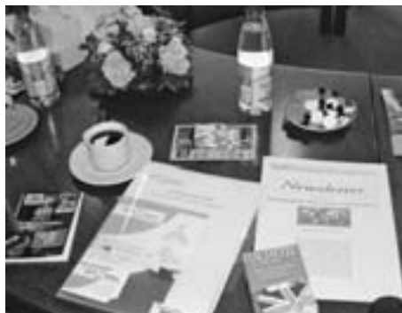
Sitzungsstillleben: Wasser, Kaffee, Papiere, Sprachführer, Süßes...