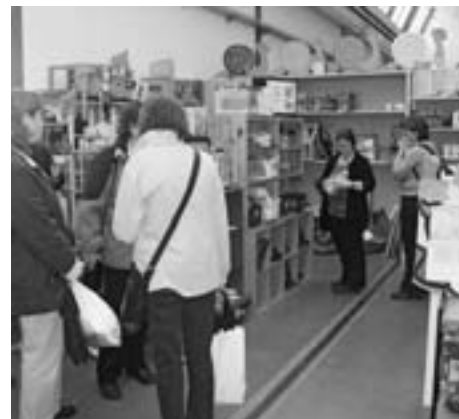
Besuch in der Ludothek Gelterkinder Visite de la ludothèque à Gelterkinder