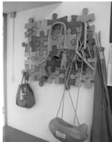
Décoration et une bonne idée Dekoration und eine gute Idee