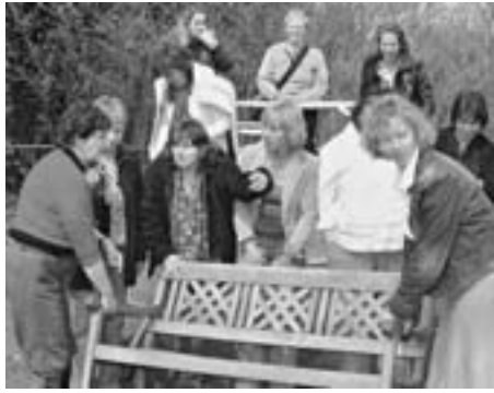
Ob es gelingt, alle Teilnehmer der Sitzung auf ein europäisches Bild zu bekommen?