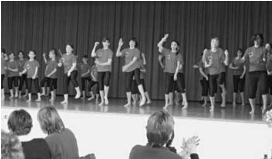
Viel Schwung mit der MiniGym Gelterkinden während dem Mittagessen Beaucoup d'élan avec MiniGym Gelterkinden pendant le déjeuner

absolviert, denen sie an dieser Stelle nochmals gratuliert.