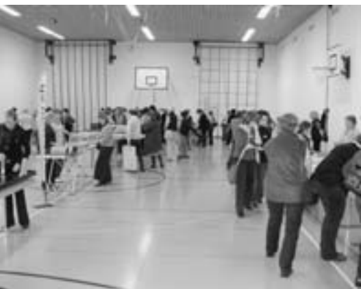
Grosses Interesse an der Spieleausstellung Grand intérêt à l'exposition de jeux

Den Jahresbericht haben alle Ludotheken schriftlich erhalten.