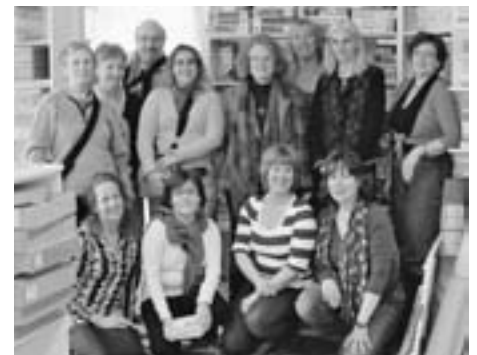
Gruppenbild in der Ludothek Spielbergh