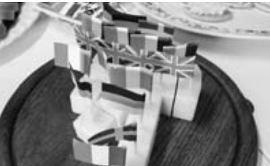
Das vielfältige Europa als Käsebuffet in Voorschoten