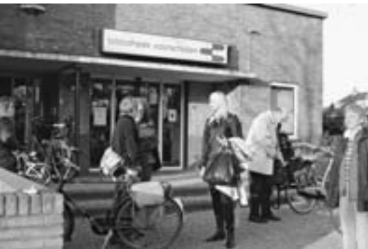
Bibliotheek und Speel-o-thek Voorschoten in der Nähe von Leiden