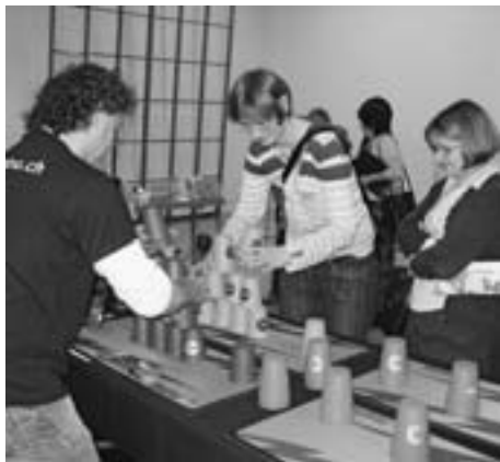
Stacking fasziniert. Stacking fascine.

Oekozentrum Schaffhausen Verein Schweizer Ludotheken Vorstadt 9 8200 Schaffhausen Tel 052 633 01 01