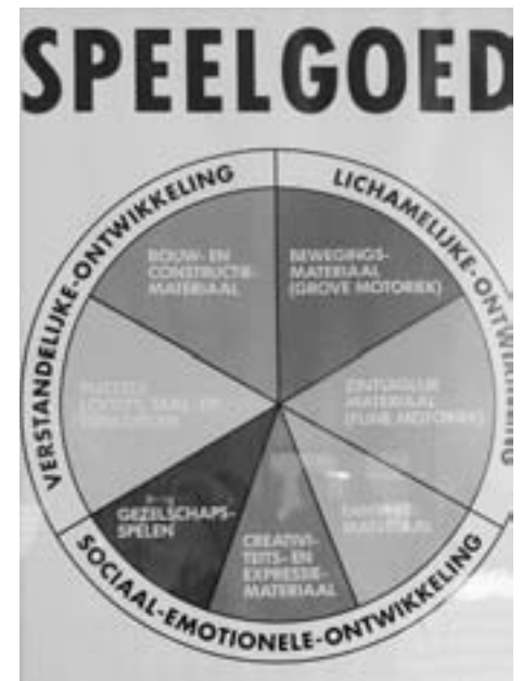
Spiel-Gut Kategorien auf Holländisch

In Portugal there have been discussions and 8 points identified. They are used as part of a contract with authorities and as a normative function for toy libraries.