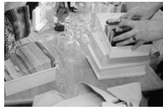
Empfang, Kunden- und Spieledatei in Voorschoten im «Karteikärtchen-System»