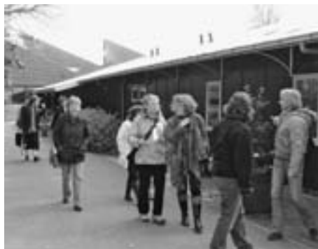
Auf dem Weg zur grössten Ludothek Hollands auf dem Areal von 's Heerenloo