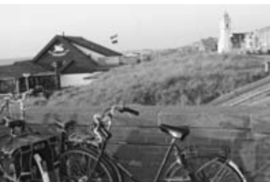
Abend in Katwijk am Meer, wo das gemeinsame Fischessen stattfindet