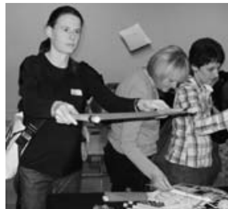
Ausprobieren, konzentrieren, jonglieren Essayer, se concentrer, jongler

Die Präsidentin schaut auf ein sehr positives Jahr zurück, in dem trotz Personalmangel das Dienstleistungsangebot des Vorstands sogar ausgebaut wurde. Sie bedankt sich herzlich bei den Vorstandsmitgliedern und den Mitarbeiterinnen aller Kommissionen für die gute und professionelle Zusammenarbeit und die vielen freiwillig geleisteten Stunden. Ihr Dank gehört aber auch den Firmen und Sponsoren, die den VSL und die Ludotheken in ihrer Arbeit unterstützt haben.