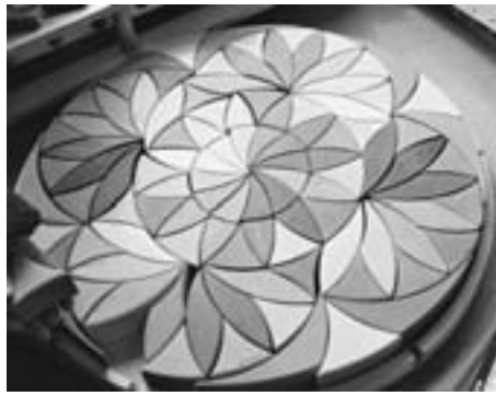
Wunderschönes und vielfältiges Spielmaterial steht zur Verfügung. Für die Party können Disco-Kugeln, Licht- und Tonanlage, Deko-Palmen usw. ausgeliehen werden!