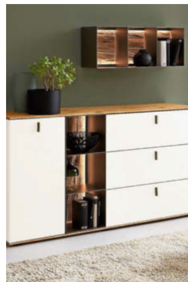
Möbel Waeber öffnet die Türen.

Während den Tagen der offenen Tür profitiert man auf dem gesamten Sortiment von 15 Prozent Rabatt und zusätzlich gleich nochmals von 5 Prozent sowie gratis Lieferung, Montage und Entsorgung.